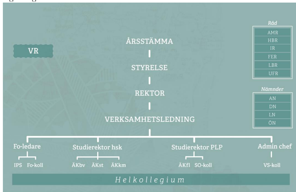
Fig. 1 Organisationsschema

Förkortningar: VR – Verksamhetsråd, Fo-ledare – Forskningsledare, IPS – Institutet för Pentekostala Studier, Fo-koll – Forskarkollegium, ÅKbv – Ämneskollegium Bibelvetenskap, ÅKst – Ämneskollegium Systematisk teologi, ÅKkm – Ämneskollegium Kyrko- och missionsstudier, ÅKfl – Ämneskollegium Föreläsning, SO-koll – Samordningskollegium, VS-koll – Kollegium för verksamhetsråd, AMR – Arbetsmiljöråd, AN – Antagningsnämnd, DN – Disciplinnämnd, FER – Forskningsetiskt råd, HBR – Hållbarhetsråd, IR – Internationaliseringsråd, LBR – Likabehandlingsråd, LN – Lärarförslagsnämnd, UFR – Utbildnings- och forskningsråd, ÖN – Överklagandenämnd